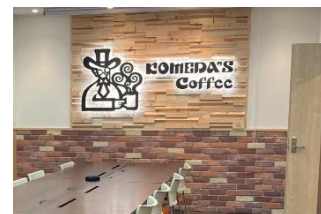
コメダ東京事務所