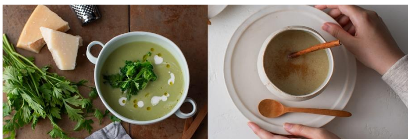
チーズ香るブロッコリーポタージュ

離乳食初期に活躍する野菜ペーストやおかゆもおまかせ。お子さんの成長度合いに合わせて活用いただけます。献立に、栄養バランスのための「あと一品」が欲しいときにも活躍します。