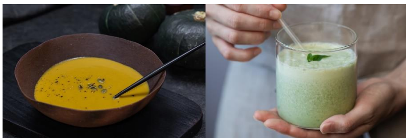
皮までまるごとかぼちゃのポタージュ