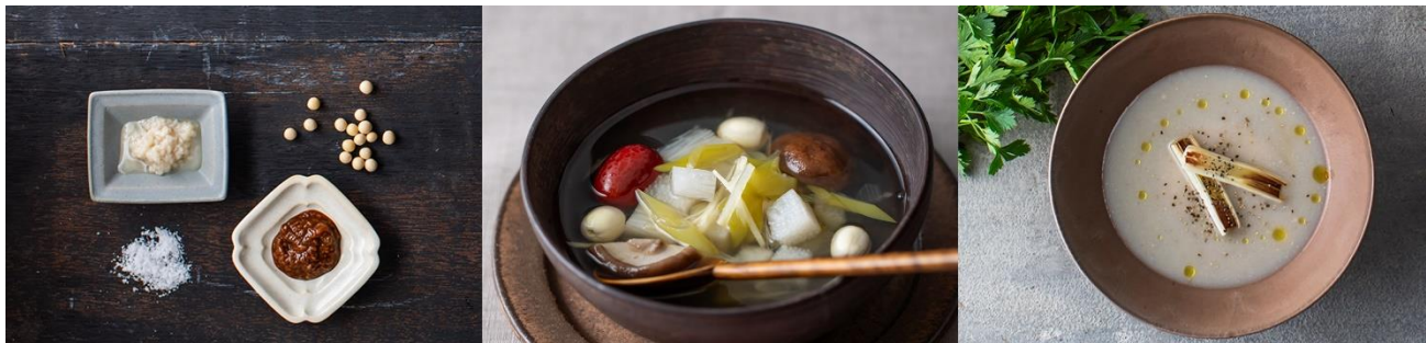
【左から】塩麴／しょう油麴、冬の薬膳スープ（生姜とネギと長芋のスープ）、里芋と長ねぎのポタージュ（煮干し使用）