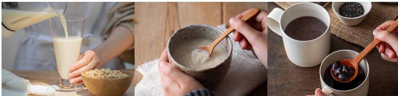
【左から】まるごと豆乳、甘酒、薬膳ホットスムージー（五黒ミックス）、黒豆茶