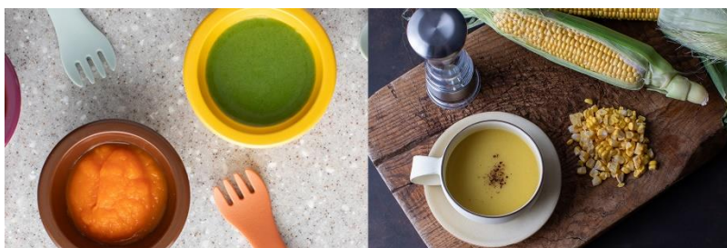
お野菜のペースト（離乳食初期～の離乳食に）