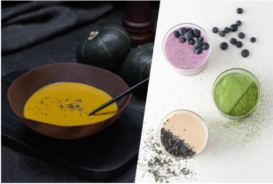
【左】皮までまるごとかぼちゃのポタージュ 【右・画像上から】ミックスベリーのフロゼンスムージー、抹茶フラッペ、オートミールときなこのスムージー

ヒーターを搭載し、スープなどのあたたかいメニューは約 90℃以上の熱々に。保温はもちろんあたため直しもできるため、鍋に移して温め直す手間なく、あたたかいスープが楽しめます。また、スムージーなどの冷たいメニューは、モーターの熱を伝えない独自の断熱構造と耐熱性の高い素材により、しっかりと冷たいまま。あたたかいものはあたたかく、冷たいものは冷たいままに仕上げます。