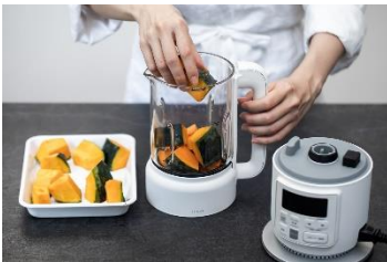
かぼちゃも皮ごとざく切りで OK

食材はざく切りで容器に入れるだけなので、下ごしらえは簡単。冷凍フルーツや冷凍野菜も解凍の手間なくそのまま調理できます。さらに、ごまや大豆などの乾燥穀物もそのまま使用でき、なめらかなスープや植物性ミルクを作ることも可能です。