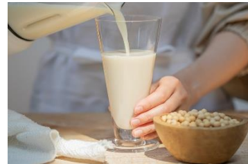
乾燥大豆から作る豆乳にも対応