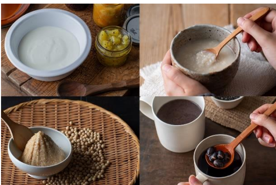
【左上から】ヨーグルト、甘酒、一晩味噌、薬膳ホットスムージー（五黒ミックス）

スープやスムージーに加え、「ヨーグルト」メニュー、甘酒や味噌などの発酵調理ができる「こうじ」メニュー、薬膳の考えに基づいたお粥やスープが作れる「薬膳」メニューなど、12 種類のオートメニューを搭載。季節やその日の体調などに合わせた幅広い料理に対応し、1 年 365 日、毎日の暮らしに寄り添います。