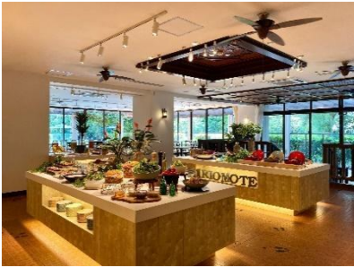
開放的なビュッフェレストラン

レストランでは、ガザミ（ワタリガニ）や黒糖など、西表島で親しまれている食材を使用した料理を、ビュッフェスタイルで楽しめます。夕食では、ガザミの出汁と黒糖を使用し、優しい味わいが特徴の「ガザミ汁」。朝食では、きび糖や黒糖シロップを丸1日しっかりと漬け込んだ「黒糖フレンチトースト」がおすすめです。