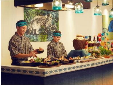
出来立てを提供するライブキッチン