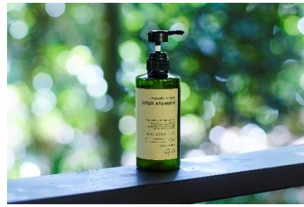
OSAJI と共同開発したオールインワンソープ