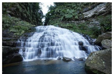
冬の雨量で水量を増す滝