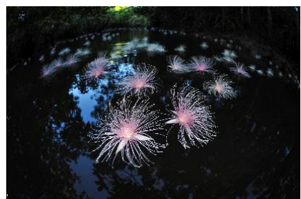
6月下旬～7月上旬に 花を咲かせるサガリバナ

サガリバナ、ジャングルの奥地の滝、ヤエヤマヒメボタルなど、西表島の魅力を生かしたイベントやアクティビティを開催しています。「日本最後の秘境」とも称される大自然の季節ごとの魅力を生かした、さまざまな体験を通して、世界自然遺産に登録された西表島の価値を感じられます。