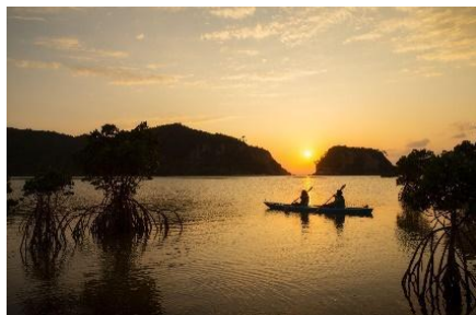
夕暮れマングローブカヤック

西表島ホテルでは、ホテルのすぐ目の前に、ジャングル、マングローブ林、珊瑚礁の海などの手付かずの自然が広がっています。西表島の醍醐味は、大自然のフィールドを制覇する様々なアクティビティです。ここでしか体験できないディープなアクティビティを楽しめます。