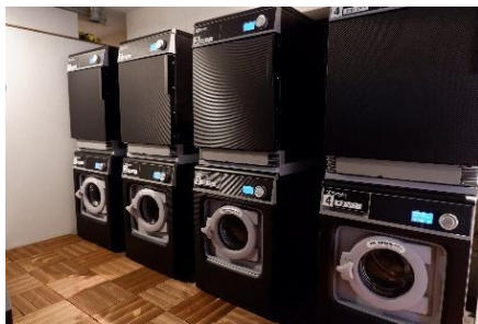
洗剤レスのスマートランドリー