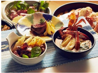
西表島で親しまれている食材を楽しむ料理