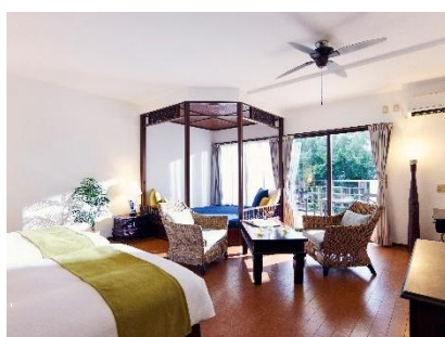
デラックスツイン