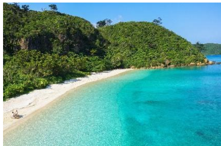
イダの浜で遊ぼう！