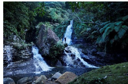
秘境ナーラの滝へ ダイナミック西表島アドベンチャー