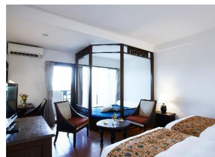
スーペリアツイン

客室タイプは、デイベッド付きやロフトタイプなど計3種類。139室を備え、西表島最大の客室数です。全室海に面しているのので、窓を開けると波の音や鳥のさえずりが聴こえてきます。テラスから見える、神秘的な夕焼けや美しい星空は絶景です。