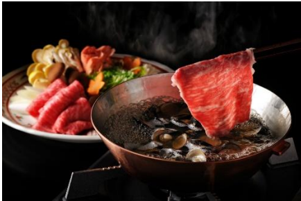
しじみの旨みを味わう「しじみ牛しゃぶ」

夕食は、ご当地の食文化を活かした会席料理を提供します。メインの台の物は、山陰の味覚のどぐろと、宍道湖の名産であるしじみがたっぷり入ったスープを使った「しじみ牛しゃぶ」です。しじみでとった滋味深いスープが牛肉の味わいを引き立てる、他にはない新しい組み合わせを楽しめます。蟹漁が解禁される秋から冬の季節は、旬の味覚「松葉蟹」を様々な調理法で提供する蟹会席を提供しています。特に、島根の伝統的な素材「石州瓦（せきしゅうがわら）」であつらえたお鍋で用意する「蟹すき鍋」は、蟹の旨味をじっくりと味わえる一品です。