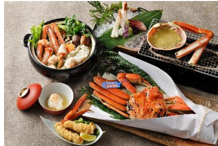
「タグ付き活松葉蟹づくし会席」