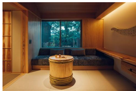
日本酒のモチーフ