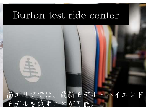
Burton test ride center