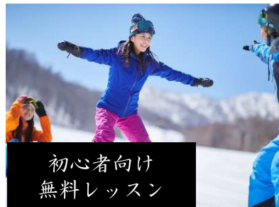
初心者向け 無料レッスン

さらに、スキヤー・スノーボーダーファーストなホテルとして滑る人に嬉しい「14時チェックアウト」などの取り組みを実施しています。スキー旅行は荷物や移動が多くて大変という方も、もっとラクに、快適に滑りを楽しむことができます。