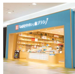
イオンモール 大和郡山店