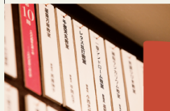
1つの教室に約10名が入門