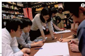
「学び」のマネジメントをプランニング(放談儀)