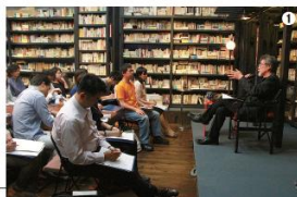
校長による編集工学講義(入伝式)